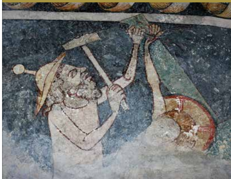
► Antijudaistische Darstellung eines Juden als „Christusmörder“, Landau Katharinenkapelle, um 1344. Dieser verbreitete Vorwurf wurde zur Legitimation mehrerer Pogrome gegen Juden instrumentalisiert.

Wie vielfältig jüdisches Leben auf dem Gebiet von Rheinland-Pfalz im Laufe der Geschichte war und heute wieder ist, vermittelt die vom Institut für Geschichtliche Landeskunde an der Universität Mainz e.V. konzipierte