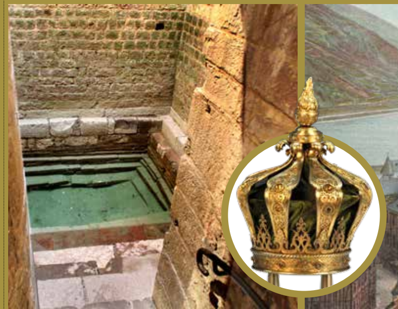
► Mikwe im Judenhof in Speyer: Das älteste Ritualbad Mitteleuropas wurde erstmals 1128 erwähnt. ► Prächtige Torakrone aus der Judaica-Sammlung im Landesmuseum in Mainz, 1898.

Wahrscheinlich lebten bereits in spätantiker Zeit im 4. Jahrhundert Jüdinnen und Juden in Trier. Hierfür steht beispielhaft eine fragmentarisch erhaltene Öllampe, die mit einer Menora verziert ist. Seit dem Frühmittelalter lässt sich jüdische Präsenz kontinuierlich an den wichtigen Lebensadern Rhein und Mosel nachweisen, die in erster Linie zahlreiche Fernhändler anlockten. Im Laufe