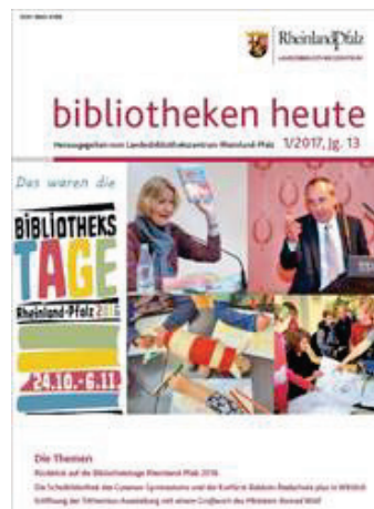
Titelseite „bibliotheken heute“ 1/2017

https://lbz.rlp.de/de/ueber-uns/presse/detail/news/detail/News/musikfans-aufgepasst-neues-internetangebot-des-lbz/