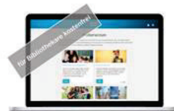
Brockhaus bietet Medienwissen für Bibliothekarinnen und Bibliothekare

www.brockhaus.de/de/medienwissen-fuer-bibliotheken