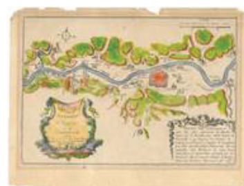
Karte „Les environs de Treves et de Consarbruch“, 1692

Das LBZ ist ab sofort auch auf Twitter vertreten. Geplant sind Tweets zu kleinen und großen aktuellen Neuigkeiten aus dem Bibliotheksalltag, Recherchetipps, Kurzmeldungen, Neuerscheinungen, Veranstaltungshinweise oder Stellenangebote. Das LBZ