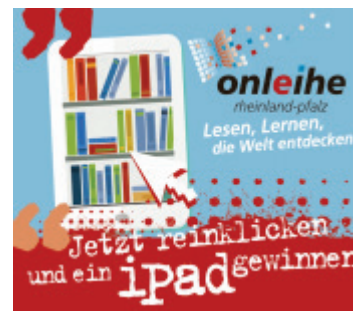
Werbekampagne Onleihe RLP

www.rpr1.de/partner/onleihe-rlp-meine-bibliothek-auf-einen-blick