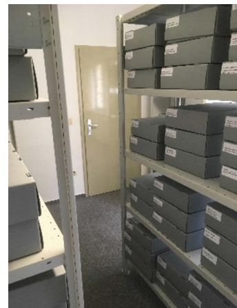
Stadtarchiv Cochem nachher

Weitere Informationen, sowie den Projektbericht der Einrichtung finden Sie unter: https://lbz.rlp.de/de/ueber-uns/landesstelle-bestandserhaltung-in-rheinland-pfalz/foerdermittel-projektantraege/ unter „Ergebnisse der Förderrunde 2019“.