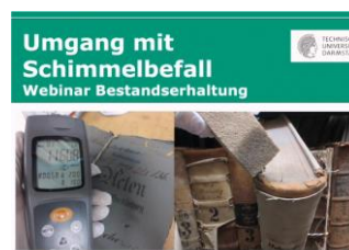
Screenshot Webinar „Umgang mit Schimmelbefall“ Jana Moczarski (ULB Darmstadt)