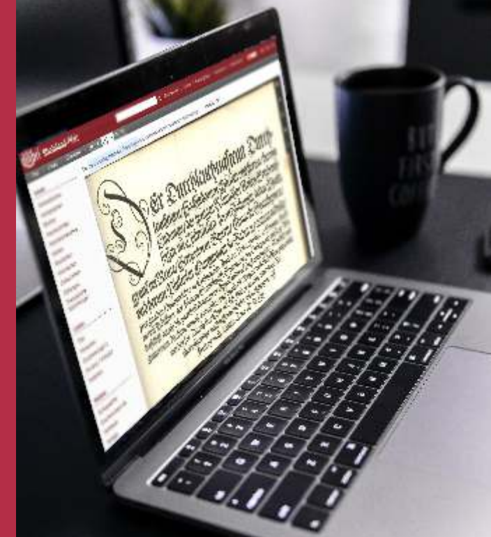
Biblia latina. [Straßburg] 1483