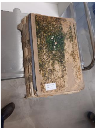
Melderegister Kyllburg Einbandschäden (Kreisarchiv)