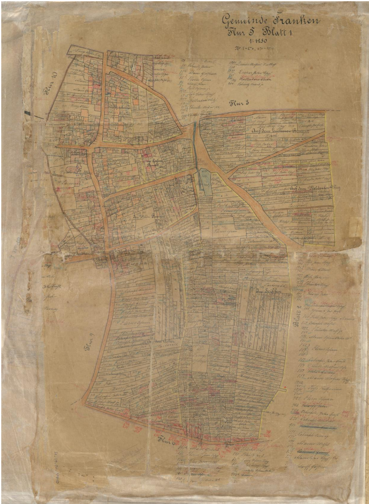
Katasterblatt Stadtteil Franken nach Restaurierung